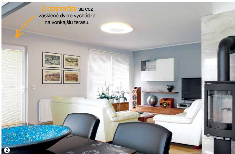
Z obývačky sa cez zasklené dvere vychádza na vonkajšiu terasu.

Záhradu budujú postupne. Prvá musela byť studňa na polievanie, teraz sú na rade systém závlahy a záhradný domček. Až potom sa budú môcť naplno pustiť do výsadby. „Máme projekt a postupne ho napĺňame. Dúfam, že budúci rok to tu už bude kompletne hotové,“ ponorí sa domáci pán do plánov.