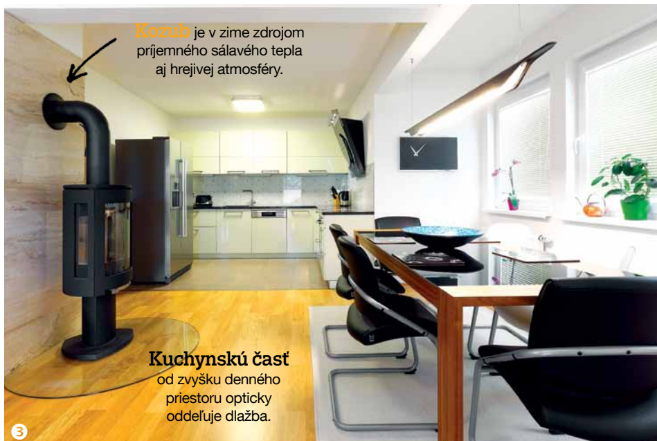
Kozub je v zime zdrojom príjemného sálavého tepla aj hrejivej atmosféry.